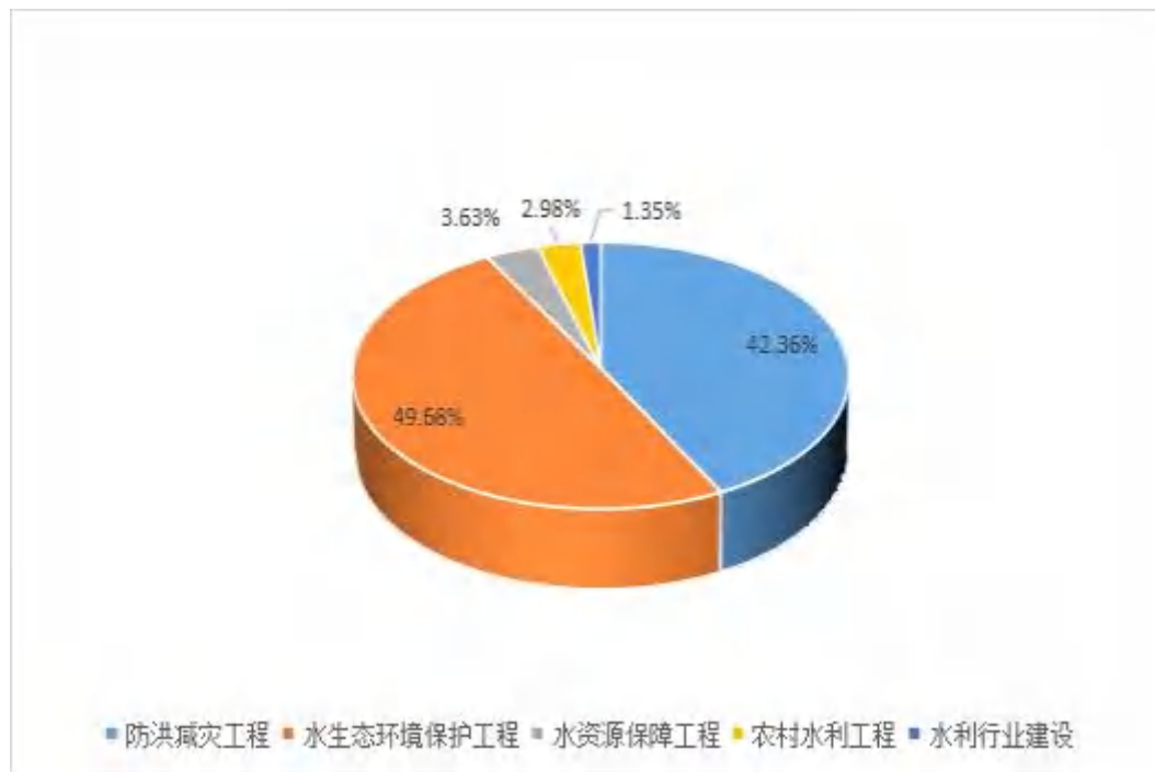
图 1.1-1 台山市“十三五”水利投资分布